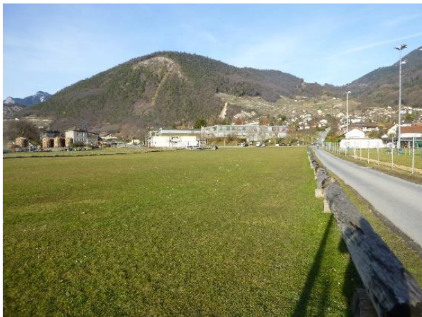
Vue depuis l'entrée du chemin du Collège