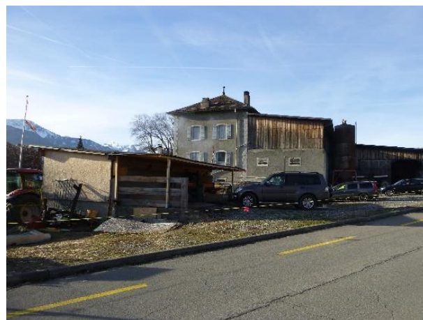
Vue de la tour Est

Une fois acquise, cette construction sera réétudiée quant au rôle qu'elle pourrait jouer au sein du complexe scolaire.