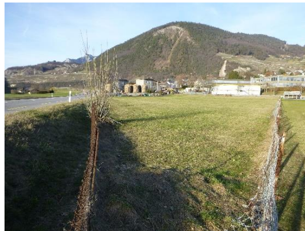
Vue depuis l'angle de la parcelle n° 922

Cette acquisition permettra d'une part, d'aborder la phase d'avant-projet libre de toute incertitude par rapport au foncier et, d'autre part, constitue une étape incontournable dans la suite de l'étude.