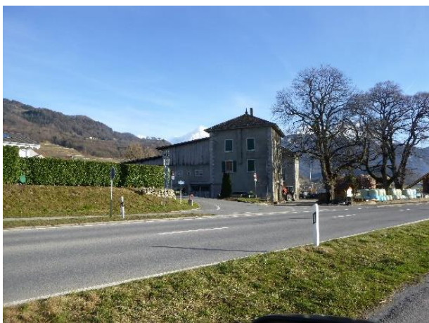
Vue de la tour Ouest depuis la Route Cantonale