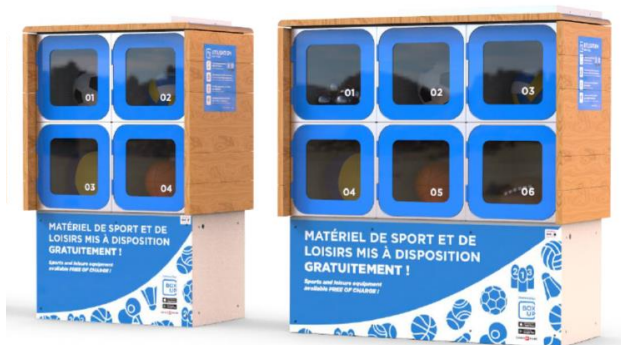
Exemple d'un système « BoxUp »

La Municipalité souhaite profiter de ce crédit d'investissement pour installer des casiers de matériel de sport en libre accès. Ce système, lié à une application (voir : https://boxup.app/fr/ ), permettra de mettre gratuitement à disposition du matériel (ballons, raquettes, matériel de fitness, etc.) pour les personnes qui fréquentent la zone sportive des Verchy et qui souhaitent pratiquer une activité sportive.