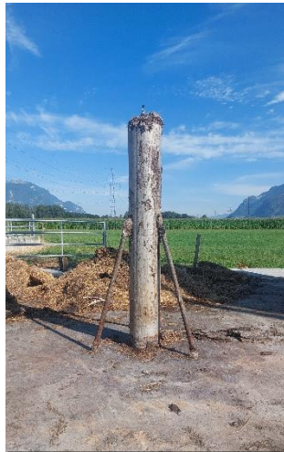
Pipe centrale actuelle