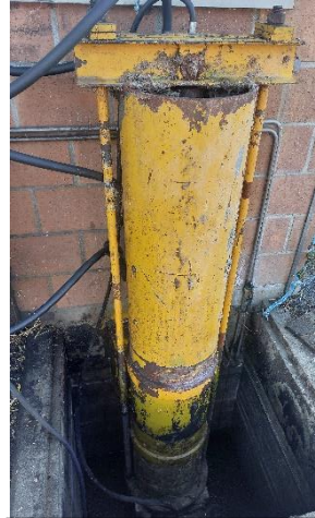
Vérin actuel fatigué

Afin de la remplacer, une solution simple techniquement est préconisée. En effet, les agrégats des fermes souffrent des contraintes mécaniques, de l'humidité et de l'acidité des matières fécales. Il semble dès lors judicieux d'installer un système robuste, simple à remplacer et facile d'accès.