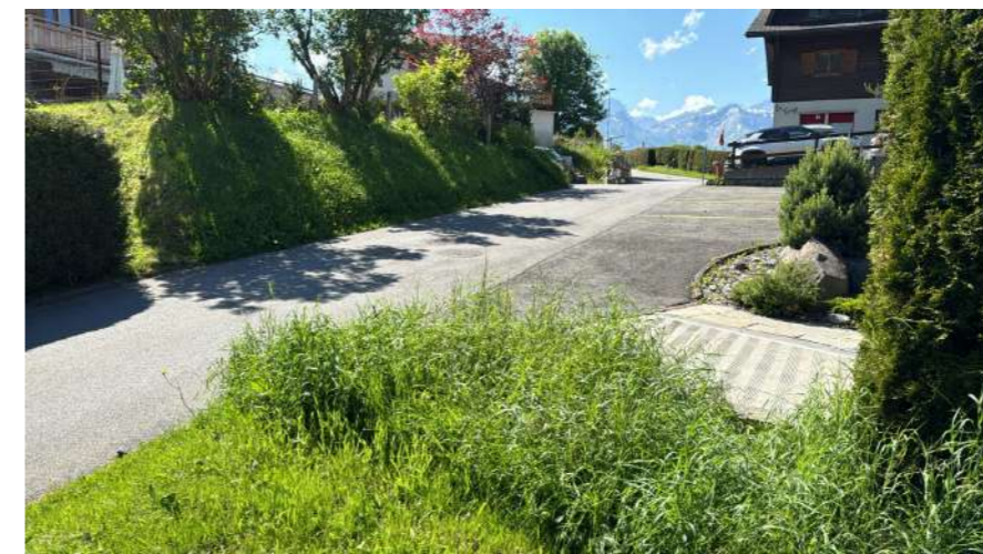
Point de vue 2